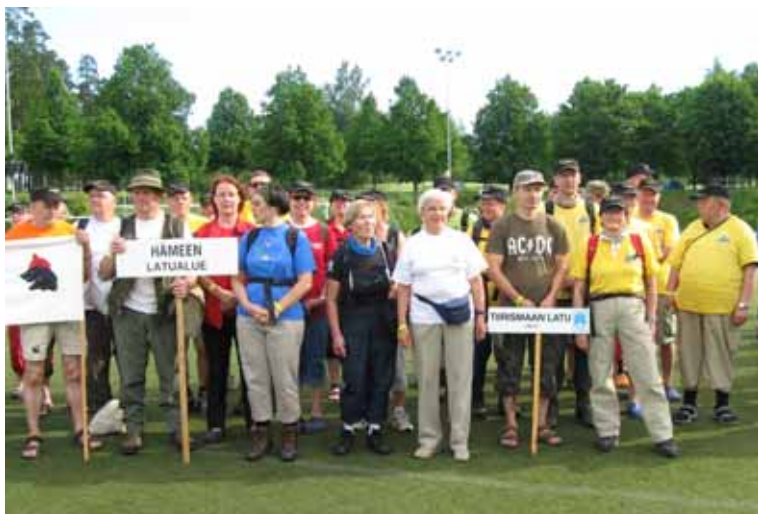
Kuva 1: Hämeen latualueen väkeä leiripäivien avajaisissa

Lauantai-aamuna kiirehdimme paikallisbussilla avajaisiin. Järjestäydyimme kulkueeseen Hämeen Latualue -kytlin taakse. Mukana oli latulaisia muun muassa Valkeakoskelta, Hämeenlinnasta, Riihimäeltä ja Lahdesta. Muutama muu Taivaltajakin leiripäivillä kuulemma oli, mutta en ainakaan siinä vaiheessa heitä havainnut tai tunnistanut. Kulkue, järjestäytyminen kentällä, lipunnosto ja puheet virittivät meidät leiritunnelmaan.