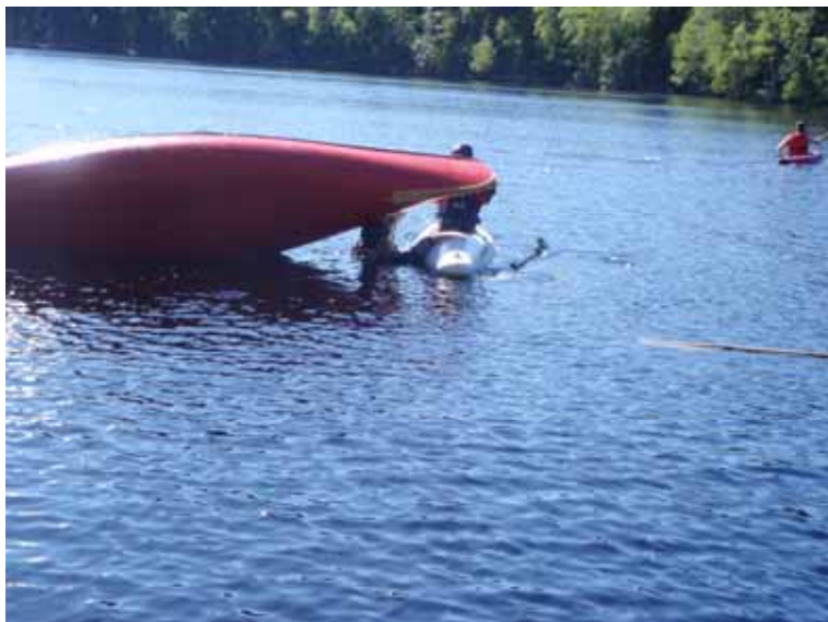
Kanootin tyhjentäminen vedestä järvellä