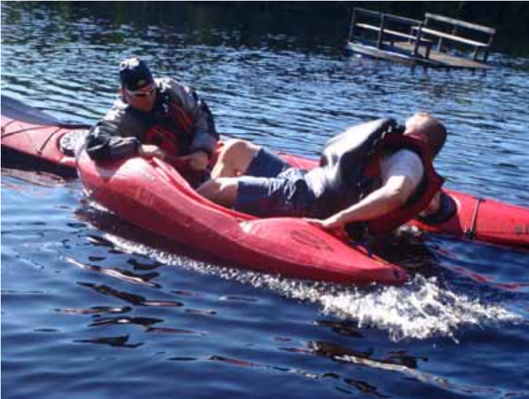
Kiipeäminen toiseen kajakkiin vesillä