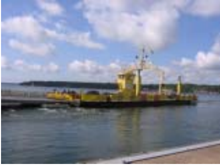
Lossia/lauttaa tarvittiin monien saarien välillä

meren tuoksua ja katsomaan maisemia toisesta perspektiivistä.