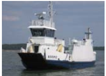
Maksullinen yhteysalus Taivassalon ja Velkuan välillä

Liikenne tieväillä Parainen-Korppoo on nykyään erittäin vilkasta ja tien pientareet ovat kapeita. Myös Kustavista Turkuun menevä tie on vilkasliikenteinen ja kapeapientareinen. (Vasta Ennysisissä pientareet levenevät.) Siksi kannattaakin Taivassalosta valita tievaihtoehto Hakkenpään, josta kulkee yhteysalus Velkuan Teersaloon.