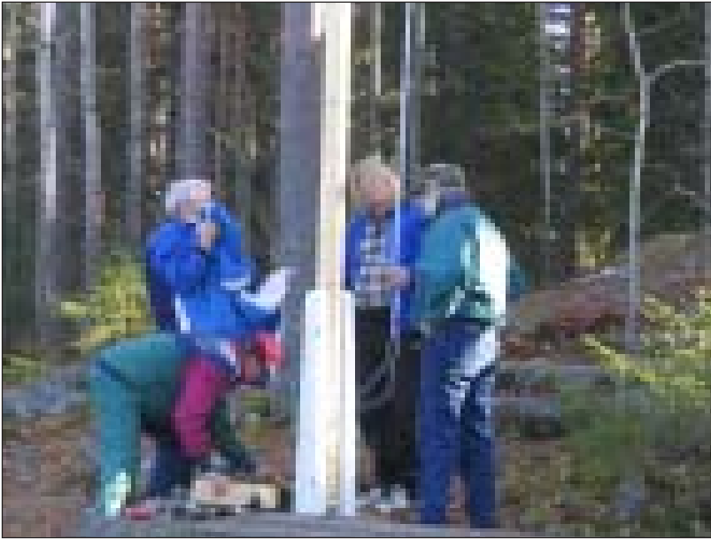
Uuden lipputangon koekäyttö