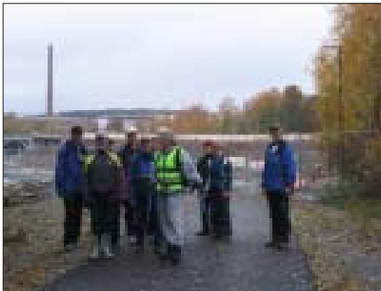
Aamun askeissa 2.10.2007 kävelemään lähti 13 henkilöä

Kurun seurakunnan ja Metsähallituksen perinteinen joululaulutilaisuus, selvitä itse kellonaika.