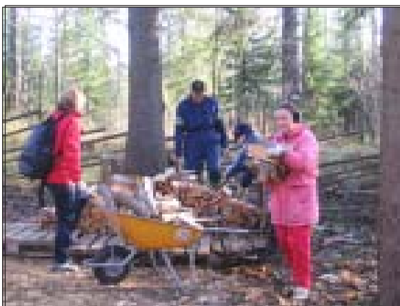
Tässä muutama talkoolainen ulkona loppusuoralla Kärryt kulkivat ja pinoa syntyi lisäksi monen muun henkilön voimin, jotka ovat kuvanottohetkellä vajalla